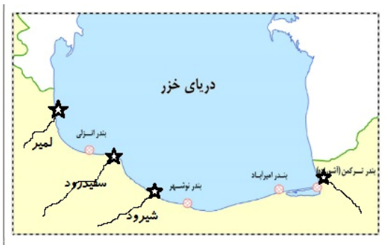
شکل ۱: رودخانه‌های نمونه‌برداری از ماهی کلمه و ماهی سفید

طی سال‌های ۱۳۹۱ و ۱۳۹۲ نمونه‌های ماهی کلمه از رودخانه لمیر در قسمت جنوب غربی و بندر ترکمن در قسمت جنوب شرقی دریای خزر (جمعا ۱۷ نمونه) و ماهی سفید از رودخانه‌های لمیر، سفیدرود و شیرود (جمعا ۲۹ نمونه) در سواحل جنوبی دریای خزر (شکل ۱) توسط صیادان محلی صید و مقداری از قسمت نرم باله دمی آن‌ها بریده و پس از قرار دادن داخل تیوپ ۱/۵ میلی لیتری حاوی الکل ۹۶ درجه به آزمایشگاه ژنتیک پژوهشکده آبی‌پروری آب‌های داخلی بندر انزلی منتقل و قبل از شروع آزمایشات مولکولی به منظور عدم حذف احتمالی الکل داخل ویال و چروکیدگی بافت باله ناشی از آن، در فریزر ۲۰- درجه سانتی‌گراد قرار داده شد.