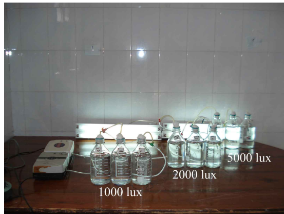
شکل ۱: تیمارهای مختلف شدت نور ۱۰۰، ۲۰۰۰ و ۵۰۰۰ لوکس

شدت‌های مختلف نوری تیمارهای مختلف مطالعه تنظیم گردید (شکل ۱).