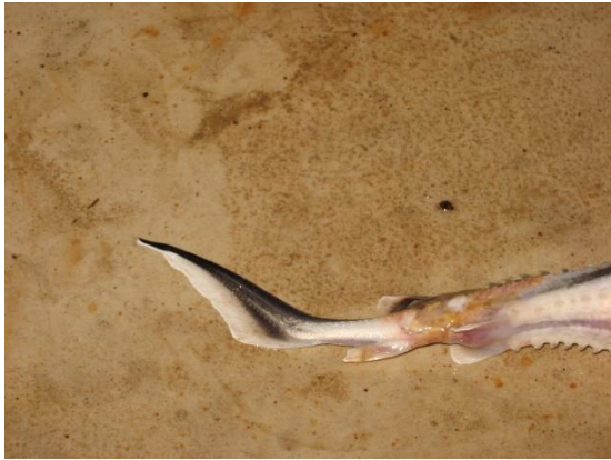
شکل ۱: وجود زخم در ناحیه جانبی و شکمی همراه با خونریزی در تاس ماهی روسی پرورشی

مختلف از ۵ جنس و ۴ خانواده باکتریایی مورد شناسایی قرار گرفتند (جدول‌های ۱ و ۲ و شکل‌های ۳ و ۴).