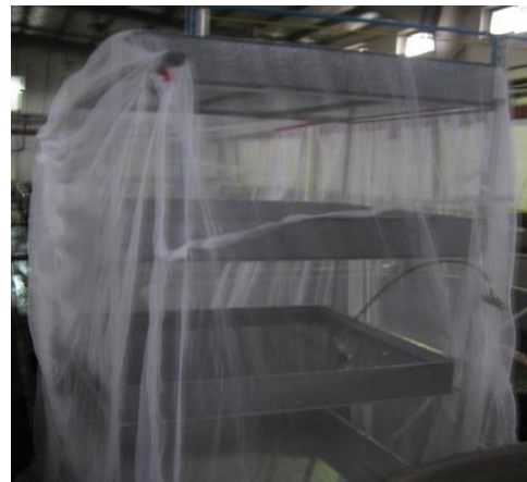
شکل ۱: سینی کشت تخم پشه شیرونومیده

سینی‌های پرورشی مجهز به سیستم آبرسانی، هوادهی و بخاری آکواریومی بودند. برای ممانعت از خروج پشه‌های تولیدی و ورود پشه‌های وحشی، قفسه فلزی به همراه سینی‌های پرورش تخم شیرونومیده در پوشش گلخانه از توری مخصوص پشه محفوظ گردید تا علاوه بر آن با اختصاص فضای پرورش برای زیست پشه‌های مولد حاصل، امکان استمرار تولید در تمامی طول سال فراهم گردد.