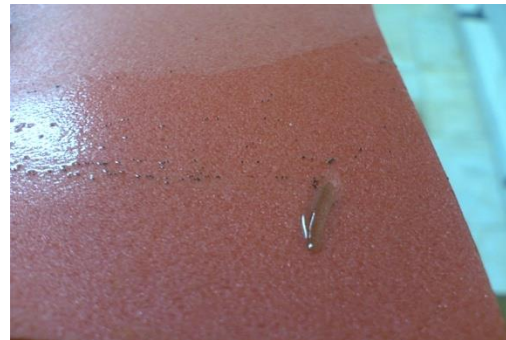
شکل ۲: جمع‌آوری تخم پشه توسط ورق‌های فومی