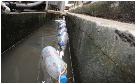
شکل ۳: جمع‌آوری تخم پشه توسط بطری‌های آب معدنی

B = وزن بوته چینی و محتویات آن پس از حرارت دادن در کوره