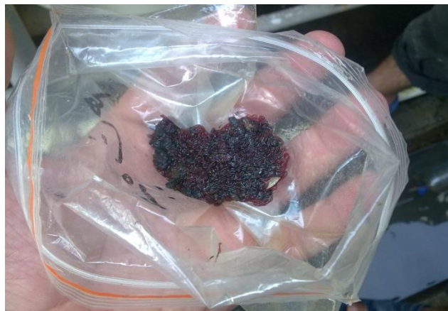
شکل ۶: لاروهای تولید شده شیرونومیده