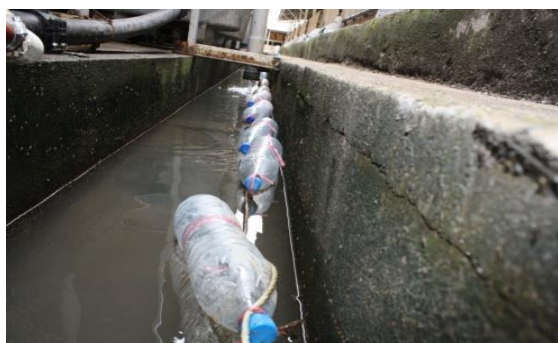
شکل ۳: جمع‌آوری تخم پشه توسط بطری‌های آب معدنی

B = وزن بوته چینی و محتویات آن پس از حرارت دادن در کوره