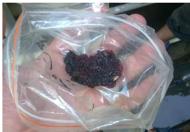
شکل ۶: لاروهای تولید شده شیرونومیده