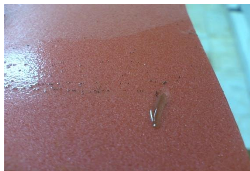
شکل ۲: جمع‌آوری تخم پشه توسط ورق‌های فومی