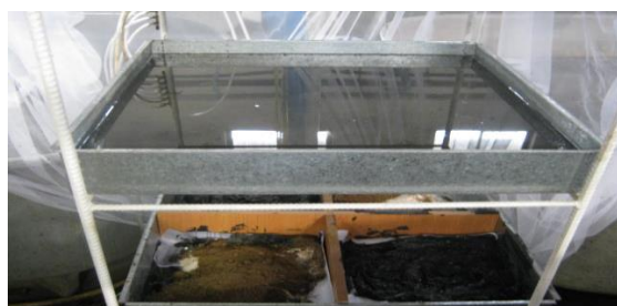
شکل ۵: سینی‌ها و رسوبات مورد استفاده