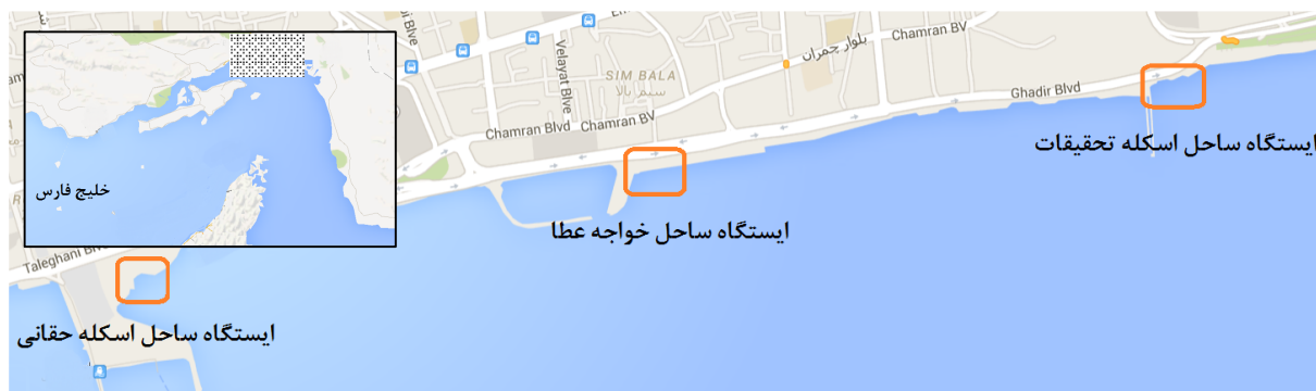
شکل ۱: منطقه نمونه‌برداری کرم پرتار P. nuntia واقع در ساحل شهر بندرعباس، ایستگاه اول: اسکله حقانی، ایستگاه دوم: خواجه عطا، ایستگاه سوم: اسکله تحقیقات.

در سال‌های اخیر ذخایر این گونه با توجه به برداشت بالا، آلودگی و تخریب مناطق ساحلی؛ در جنوب ایران نیز رو به کاهش نهاده است که لزوم توجه جدی به امکان پرورش مصنوعی آن را آشکار می‌سازد. بدون شک یکی از مهمترین ارکان مدیریت گونه‌ها، مطالعه روند تولیدمثلی و تغذیه آنها می‌باشد و بهره‌برداری از ذخایر آبزیان و صید بی‌رویه آنها بدون توجه به زمان بلوغ تولید مثلی و باروری تهدیدی جدی برای ذخایر خواهد بود. تغییرات مرحله بلوغ در طول سال اهمیت زیادی در ساختار علم زیست‌شناسی تولید مثل دارد و به عنوان مثال اطلاعاتی همچون وضعیت هماوری و اندازه اولیه بلوغ و سایر خصوصیات تولید مثلی برای رسیدن به یک برنامه موفق صید و پرورش آبزیان بسیار موثر هستند (Biswas, 1993). هدف از تحقیق حاضر تعیین میزان هماوری کرم پرتار P. nuntia و ارتباط آن با وزن کل گونه، اندازه‌گیری قطر