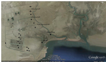
شکل ۱. مجتمع پرورش میگوی غرب باهو کلات

محل اجرای طرح در مجتمع پرورش میگو غرب باهو کلات، در منتهی‌الیه جنوب شرقی کشور و با طول جغرافیایی ۳۰^{\circ} ۶۱' شمالی و عرض جغرافیایی ۱۱' ۲۵'' شرقی در مرز ایران و پاکستان در حاشیه جنوب غربی پائین دست رودخانه باهو کلات و خور گواتر واقع گردیده است و از دو سایت شمالی و جنوبی با مساحت ۴۰۰۰ هکتار و سطح مفید ۲۵۰۰ هکتار (۵) تشکیل شده است (شکل ۱). در طی سال‌های اجرای طرح