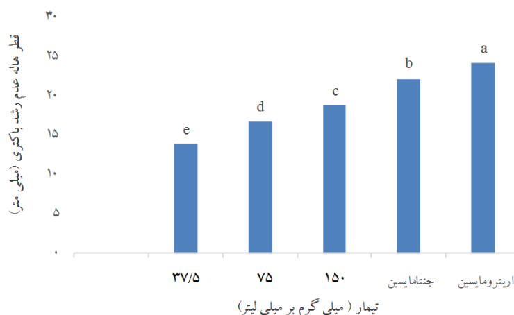
شکل ۲: مقایسه اثر ضد باکتریایی عصاره آبی گل درخت گردو با آنتی‌بیوتیک‌های رایج علیه باکتری آثروموناس هیدروفیلا.

غلظت‌های ۱۵۰، ۷۵ و ۳۷/۵ میلی گرم بر میلی لیتر عصاره اتانولی گل درخت گردو با هم اختلاف معنی‌داری به ازای قطر هاله عدم رشد داشتند. با توجه به اختلاف معنی‌دار غلظت‌های مختلف عصاره نتایج بازگوکننده افزایش اثر ضد باکتریایی عصاره به ازای افزایش غلظت آن‌ها می‌باشد، می‌توان گفت با افزایش غلظت عصاره، قطر هاله بازدارندگی نیز افزایش می‌یابد.