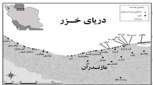
شکل ۱: محل ایستگاه‌های نمونه برداری (پره‌های صیادی) در سواحل شرقی حوزه جنوبی دریای خزر (سال ۱۳۹۱)

سپس در محفظه داغ (هیتر دایجست) در دمای ۹۰ درجه سانتی گراد به مدت ۳ ساعت عمل هضم انجام گردید. پس از خنک شدن، نمونه‌ها با آب مقطر دوبار تقطیر و کاغذ صافی نمونه‌ها صاف شده و به حجم نهایی ۵۰ میلی لیتر رسانده شدند