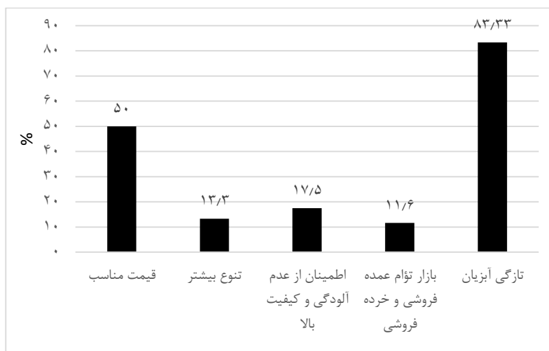
شکل ۱: درصد فراوانی دلایل خرید مصرف کنندگان بازار ماهی تهران از دید فروشندگان

ترتیب در اولویت‌های بعدی خرید مردم از این بازار هستند.