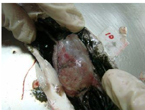
شکل ۲: بادکردگی کیسه شنا در ماهیان بیمار

مهم ترین یافته اتساع شدید کیسه شنا بود (شکل ۲). هیچگونه مایعی در داخل محوطه بطنی مشاهده نگردید. کیسه صفرا در این ماهیان کاملاً پر بود که عدم تغذیه طولانی مدت را نشان می داد. نتایج حاصل از بیومتری و تعیین سن ماهیان در جدول ۱ آمده است.