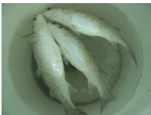
شکل ۱: وضعیت قرارگیری ماهیان بیمار در آب