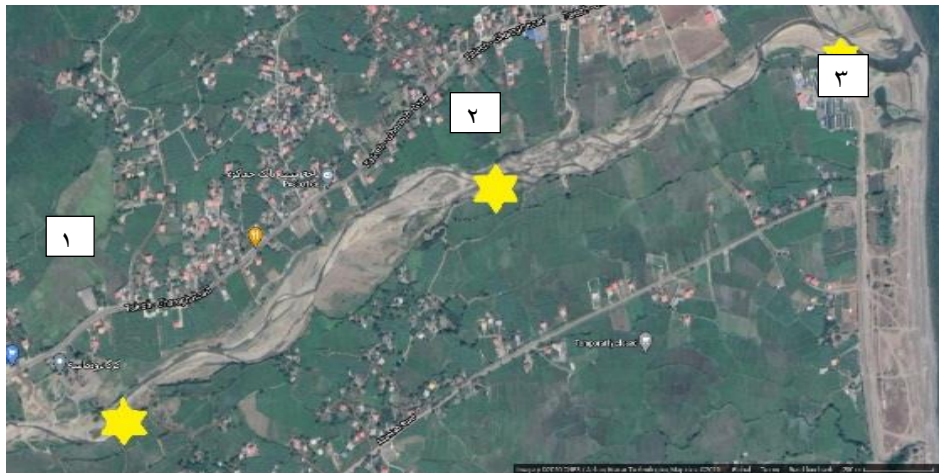
شکل ۱: نمای رودخانه کرگانرود و ایستگاه‌های تعیین شده جهت نمونه برداری (با ستاره زرد مشخص شده)

نمونه برداری از ایستگاه‌های تعیین شده قبل از رهاسازی بچه ماهیان و در تاریخ‌های ۱۳۹۸/۳/۲۶ و ۱۳۹۸/۴/۳ انجام شد. نمونه برداری‌ها با ۳ تکرار صورت گرفت. جمع آوری نمونه‌ها بین ساعات ۹ تا ۱۱ انجام شد. حداقل و حداکثر عمق آب رودخانه در زمان رهاسازی بچه ماهیان به ترتیب ۱۰ و ۳۰ سانتی‌متر بود.