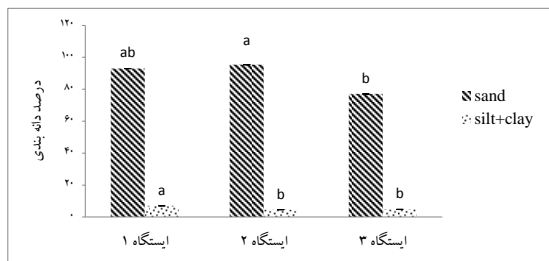
شکل ۴: مقایسه درصد دانه بندی بافت بستر در ایستگاه‌های مختلف در رودخانه کرگانرود

موجودات بنتیک شناسایی شده در ایستگاه‌های مورد مطالعه شامل شیرونومیده از رده حشرات، گاماروس از رده سخت پوستان، لیمنه آ از رده شکم‌پایان و لارو حشرات بود. میزان زی توده شیرونومیده، گاماروس و لارو حشره در ایستگاه ۳ به میزان معنی داری بیشتر از میزان زی توده آن‌ها در ایستگاه‌های ۱ و ۲ بود ( p < 0.05 ). نتایج حاصل از بررسی و شمارش نمونه‌های موجودات بنتیک در شکل ۲ آمده است. نتایج مربوط به میزان مواد آلی بستر و همچنین وضعیت دانه بندی بافت بستر به ترتیب در شکل‌های ۳ و ۴ آمده است.