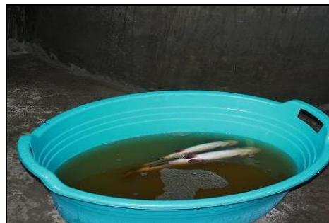
شکل ۲. بیهوش کردن ماهی‌ها با استفاده از پودر گل میخک (سمت راست)، زیست‌سنجی ماهی (سمت چپ)