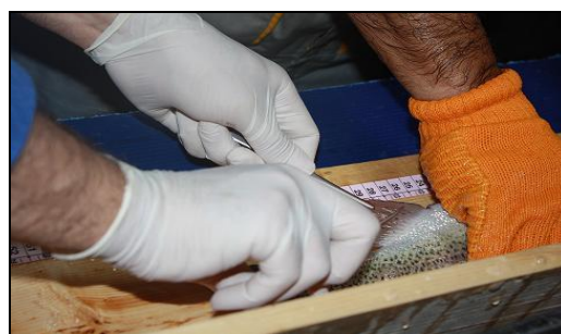
شکل ۳. نمونه‌گیری از باله ماهی و فیکس کردن در الکل ۹۶٪

سازمان‌های دولتی که مسئول ایجاد و اجرای سیاست‌های ملی بهداشت آبزیان هستند، اغلب مشکلاتی در ایجاد برنامه‌های امنیت زیستی مؤثر ملی،