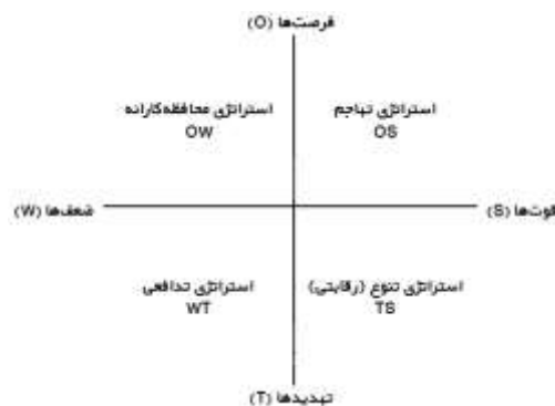
شکل ۱: تحلیل کمی SWOT و ماتریس استراتژیک (Chang and Huang, 2006).

در تحلیل SWOT سازمان‌ها در چهار قسمت قرار می‌گیرند (شکل ۱). بعد عرضی بیانگر محیط خارجی (فرصت‌ها و تهدیدها) است، درحالی‌که بعد افقی نشان‌دهنده محیط داخلی (قوت‌ها و ضعف‌ها) است.