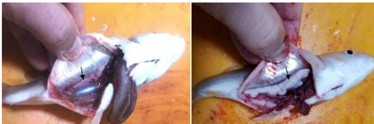
شکل ۲: وضعیت اندام‌های جنسی نر (سمت راست) و ماده (سمت چپ) کپور معمولی در سن هفت ماهگی Figure 2: gonad of female (left) and male (right) common carp in the age of seven months.