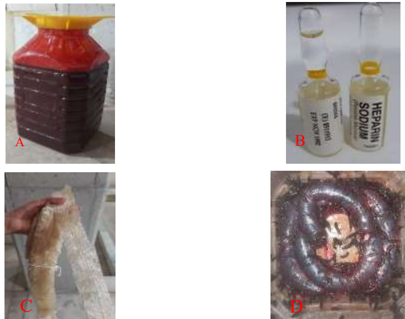
شکل ۱: پت حاوی خون تازه گاو (A). ویال هپارین برای جلوگیری از انعقاد خون در زمان جابه جایی تا خون دهی به زالوها (B). روده خشک استریل گاو (C). تغذیه زالوها از خون ریخته شده داخل روده گاو (D)