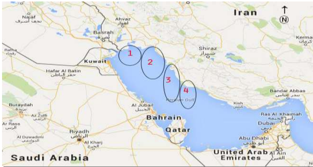
شکل ۱: ایستگاه‌های نمونه برداری روی نقشه جغرافیایی خلیج فارس

۱۳۹۳)، مشخصات جغرافیایی مناطق نمونه برداری به ترتیب در جدول ۱ و شکل ۱ نشان داده شده است (فراهانی و مرادی، ۱۳۷۷).