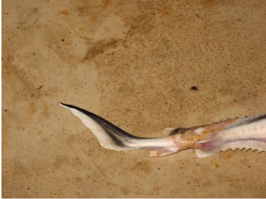
شکل ۱: وجود زخم در ناحیه جانبی و شکمی همراه با خونریزی در تاس ماهی روسی پرورشی

مختلف از ۵ جنس و ۴ خانواده باکتریایی مورد شناسایی قرار گرفتند (جدول‌های ۱ و ۲ و شکل‌های ۳ و ۴).