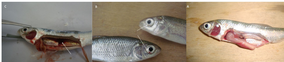
شکل ۳: بررسی علایم کلینیکی و کالبد گشایی در ماهیان مواجهه شده با آمونیاک مولکولی: عدم مشاهده عارضه غیر طبیعی در گروه شاهد (A)، خونریزی در قاعده چشم‌ها در گروه‌های تیمار (B) و پرخونی در کلیه‌ها (C)