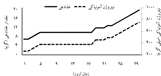
شکل ۱: مقادیر غذادهی روزانه و آمونیاک ورودی به سیستم طی دوره فعال سازی بیوفیلترها

روز به ۴/۲٪ (۱۰ گرم به هر تانک) افزایش یافت. مقدار غذادهی تا روز ۱۸ ثابت بود، سپس با کاهش آمونیاک آب تانک‌های پرورشی، مقدار غذادهی به صورت تدریجی افزایش یافت. به تبع افزایش مقدار غذادهی، ورودی آمونیاک به هر سیستم نیز افزایش یافت، به طوری که در ابتدای دوره، مقدار آن ۲۶۵ میلی گرم و در انتهای دوره، ۷۵۶ میلی گرم بود (شکل ۱).