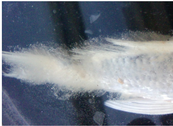
شکل ۱: ماهی کوی دارای آلودگی شدید قارچی

جداسازی نمونه‌های قارچی: آلودگی‌های قارچی که به صورت کرک‌های پنبه‌ای بود (شکل ۱) از پوست ماهی کوی برداشته و بر روی محیط کشت سیب‌زمینی دکستروز آگار ۱ (PDA) کشت داده شد. سپس به مدت ۵ الی ۷ روز در دمای ۲۵ درجه سانتی‌گراد در انکوباتور نگهداری شدند، جهت به‌دست آوردن کلنی‌های خالص قارچ، نمونه‌های کشت داده شده مجدداً در محیط سیب‌زمینی دکستروز آگار کشت داده شدند (James and Natalie, 2001).