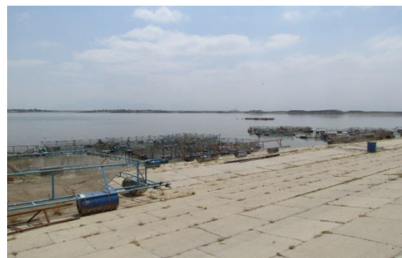
شکل ۲: مرحله‌ی تکمیل ساخت قفس‌ها در سد گلستان