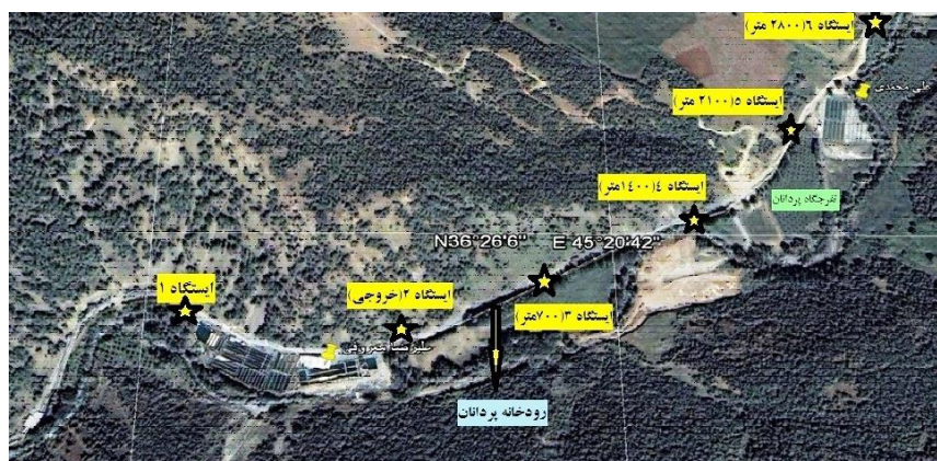
شکل ۱: موقعیت ایستگاه‌های نمونه برداری شده

گونه‌های مختلف کفزیان به تفکیک هر ایستگاه پس از جداسازی و شناسایی آنها در هر ایستگاه تعیین گردید. جهت ارزیابی کیفیت آب در هر ایستگاه از شاخص زیستی هیلسینهوف Hilsenhoff Family Biological Index (HFBI) استفاده شد (Hilsenhoff, 1988). تجزیه و تحلیل داده‌های بدست آمده با استفاده از نرم افزار آماری SPSS ویرایش ۱۷ انجام شد. برای بررسی اختلاف معنی دار داده‌های فیزیکی و شیمیایی و شاخص‌های زیستی بین ایستگاه‌ها از آنالیز واریانس یک طرفه (One way Anova) و برای مقایسه میانگین‌ها از آزمون دانکن در سطح احتمال ۵ درصد استفاده شد.