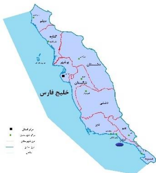
شکل ۱: نقشه منطقه مورد مطالعه در استان بوشهر- بندرکنگان

نتایج حاصل از سنجش سرب و نیکل در بافت عضله ماهی باس دریایی پرورشی به شرح جدول ۲ به- دست آمد. البته شایان ذکر است که میانگین غلظت سرب و نیکل در بافت عضله ماهی باس دریایی پرورشی مورد مطالعه به ترتیب ۰/۷۶ میکروگرم بر گرم و ۱/۱۶ میکروگرم بر گرم محاسبه گردید.