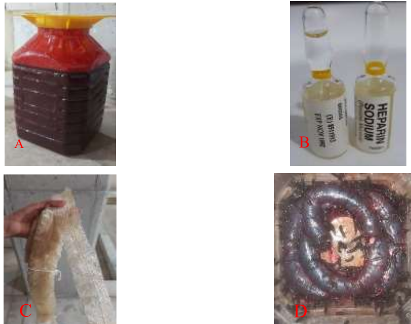
شکل ۱: پت حاوی خون تازه گاو (A). ویال هپارین برای جلوگیری از انعقاد خون در زمان جابه جایی تا خون دهی به زالوها (B). روده خشک استریل گاو (C). تغذیه زالوها از خون ریخته شده داخل روده گاو (D)