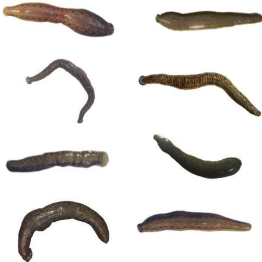
شکل ۴: زالوهای شرقی در حال درمان با داروی لینکومایسین پس از گذشت دو هفته