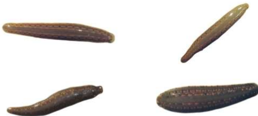
شکل ۵: زالوهای شرقی درمان شده با داروی کیمیلینکو پس از گذشت چهار هفته

همچنین، مشاهده شد که بالا آوردن خون با افزایش اندازه زالو افزایش می‌یابد. نتایج این تحقیق نشان داد که بین اندازه زالو و روند درمان رابطه مستقیمی وجود دارد. به طوری که با افزایش ابعاد بدن زالو، شدت علائم بالینی بیشتر، روند بهبودی کندتر و میزان پاسخ‌گویی به درمان کاهش می‌یابد. این موضوع ضرورت بازنگری در دوز درمانی و مدت زمان مداخله دارویی در زالوهای بزرگ‌تر را برجسته می‌سازد.