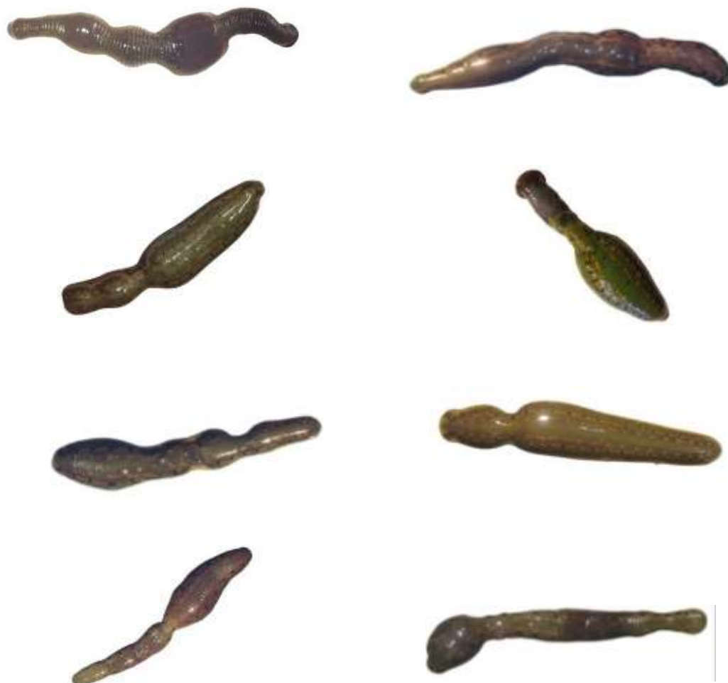
شکل ۲. بندی شدن بدن زالوی شرقی یک هفته پس از خون‌دهی