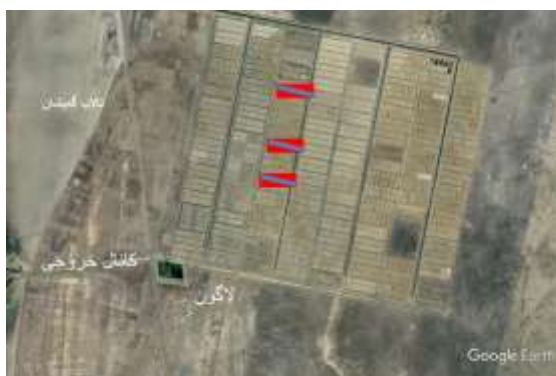
شکل ۱: نقشه مزارع مورد تحقیق (قرمز رنگ)، سایت میگوی گمشان، استان گلستان

بررسی تنوع استفاده شد، حدود آن بین ۰ تا ۵ متغیر است. اعداد کمتر نشانه وضعیت نامناسب استخرها از نظر تنوع است (Shannon and Weaner, 1949). شاخص یکنواختی ایونس برای بررسی یکنواختی توزیع گونه‌ها استفاده می‌شود. هرچه توزیع گونه‌ها یکنواخت‌تر باشد، اعداد شاخص به سمت ۱ میل می‌کند (Pielou, 1966). شاخص مارگالف نیز برای بیان غنای گونه‌ای منبع آبی استفاده می‌شود (Margalef, 1958) که حدود آن بین ۰ تا ۱ متغیر است. برای رسم نمودارها از برنامه اکسل استفاده شد.